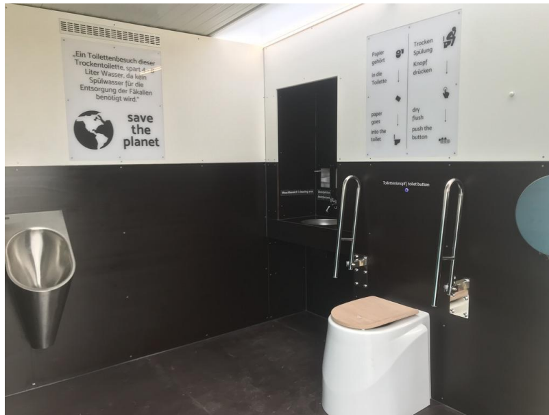
Innenraum Barrierefrei mit unterfahrbaren Waschbecken