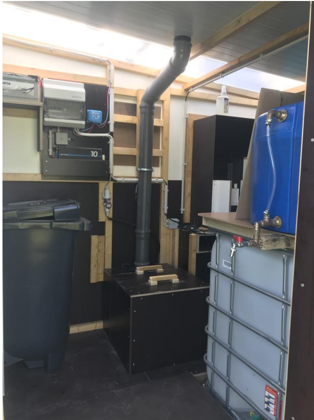
Darstellung des Depotinnenraums mit Förderband, Feststoffbehälter, Elektronik, Entlüftung und Regenwassertank