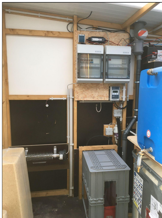
Darstellung des Depotinnenraums mit Förderband, Feststoffbehälter, Elektronik, Entlüftung und Regenwassertank