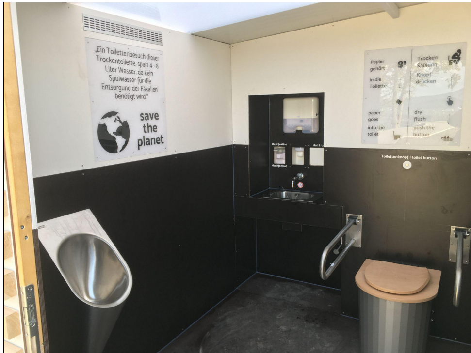
Innenraum Barrierefrei mit unterfahrbaren Waschbecken