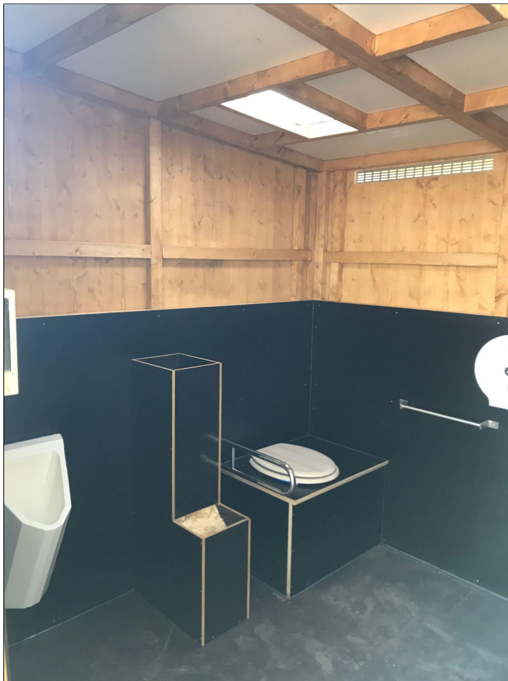
Ohne Streuautomat in Abbildung